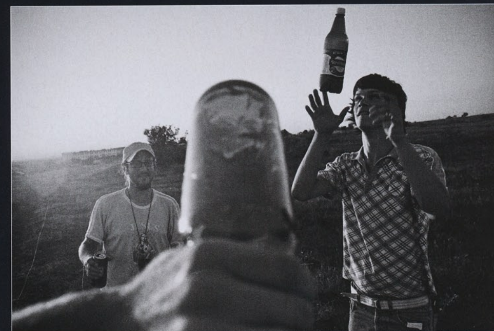
Tomáš Dvořák – Sevastopol Nikon FM2n, 28mm, Ilford PAN400/Microphen