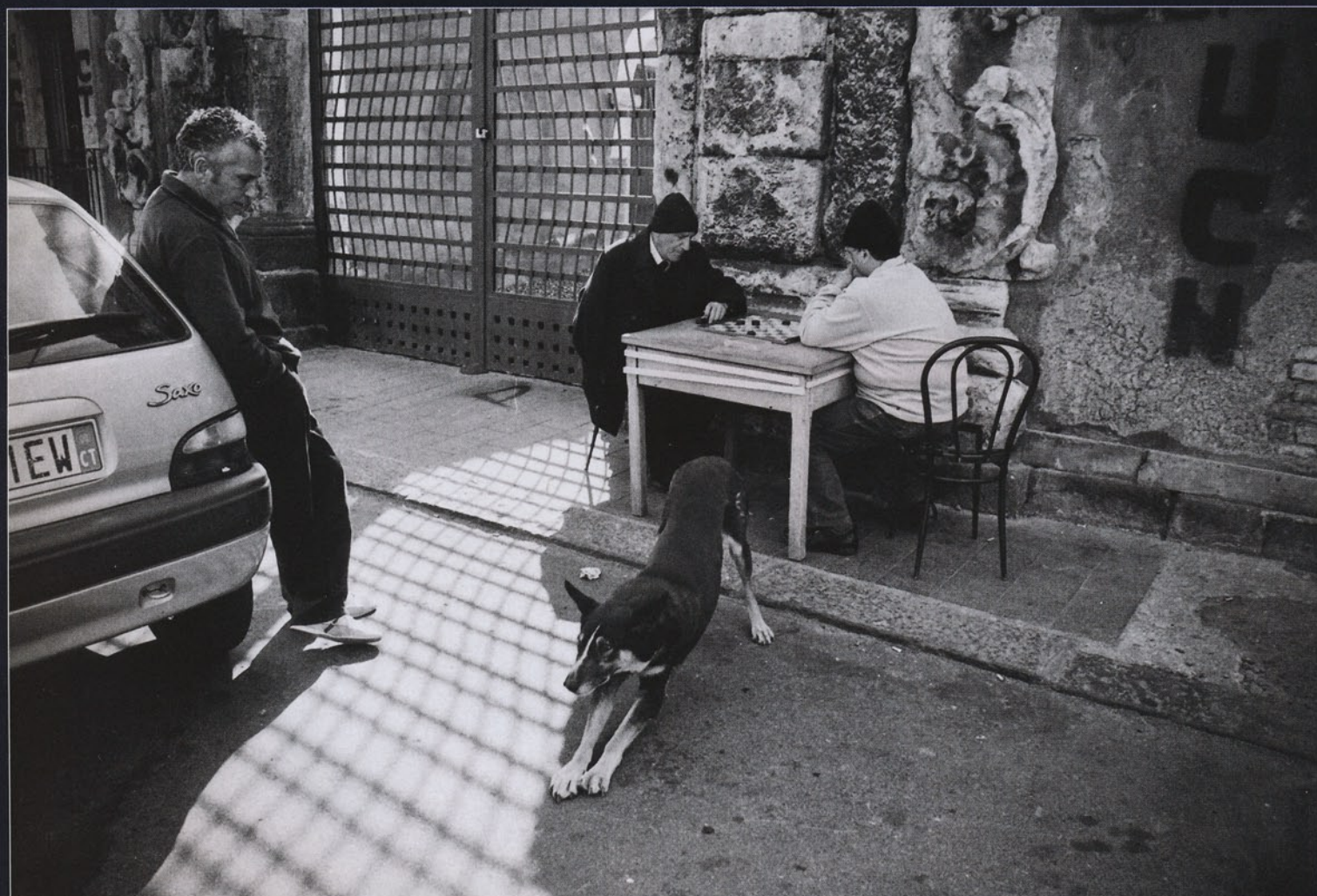
Tomáš Dvořák – Catania Nikon FM2n, 28mm, Ilford PAN400/ID11